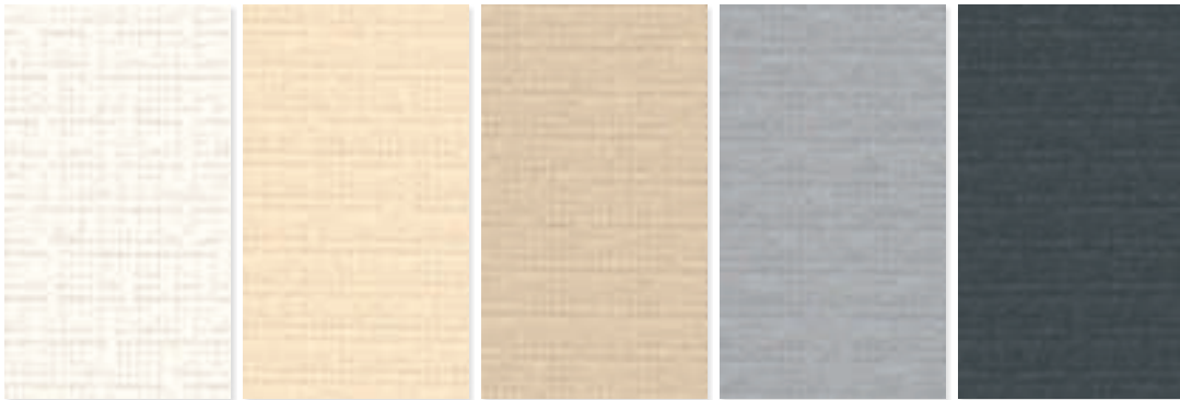
PE 90W (Weiß) PE 100W (Creme) PE 110W (Beige) PE 120W (Grau) PE 130W (Anthrazit)