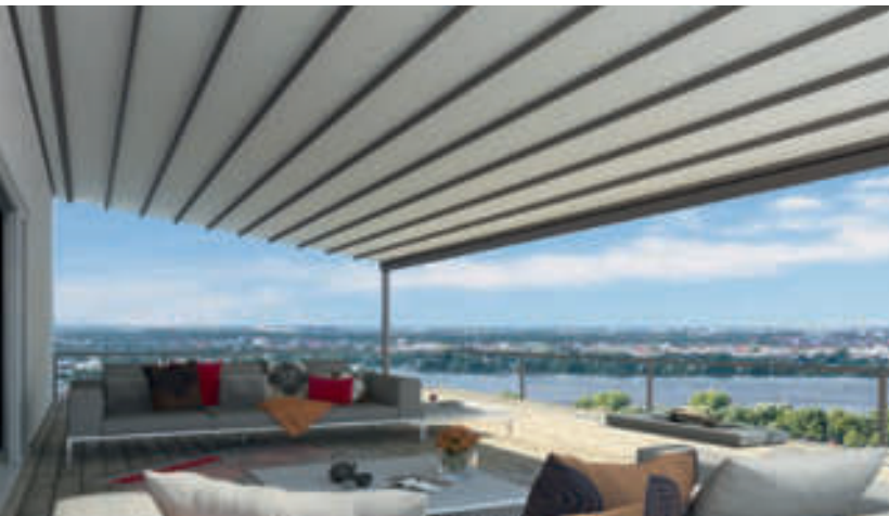
Gestellfarbe WT 029/70786 | Dessin Pergona® classic PE 140 (Weiß)

9 WiGa-Trendfarben 47 Standard-RAL-Farben Stimmen Sie die weinor PergoTex II perfekt auf Ihre Terrasse ab.