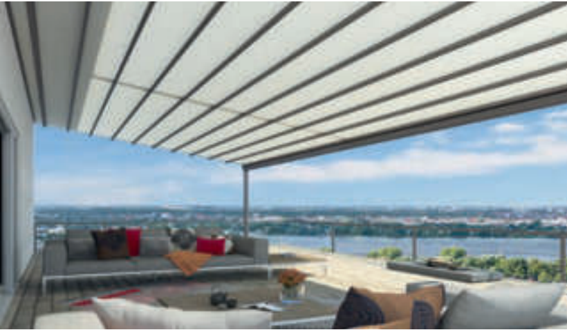
Gestellfarbe WT 029/70786 | Dessin Pergona® transluzent PE 90W (Weiß)