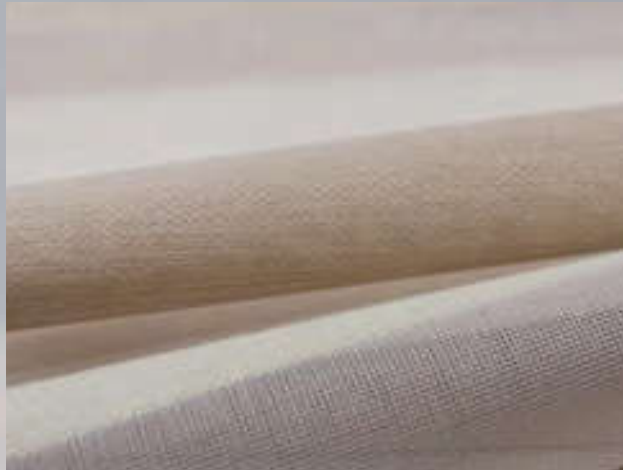
ALVA und FINYA stehen für natürliche Eleganz