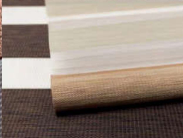
MALIN, MOA und LIV wirken besonders naturverbunden