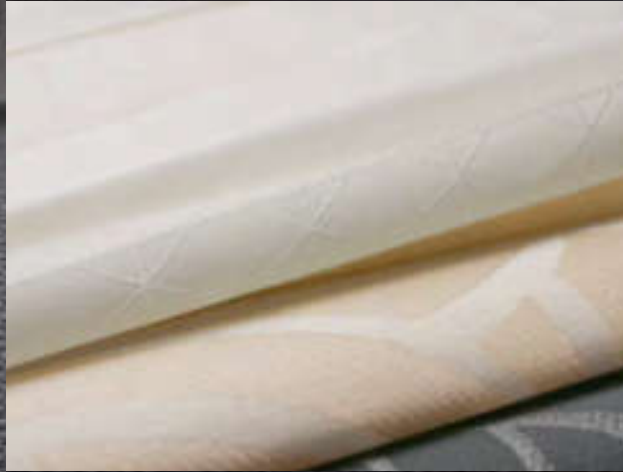
VICTOR und VIOLA sind Jacquarddessins, die dezent am Fenster Wirkung zeigen