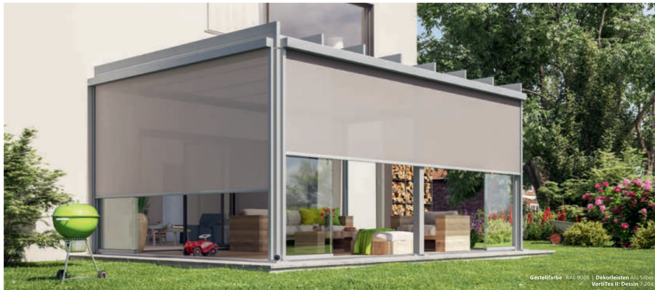
Gestellfarbe RAL 9006 | Dekorleisten Alu Silber VertiTex II: Dessin 7-204

Sie möchten von den Seiten und von vorne vor Blicken und blendendem Licht geschützt sein? Dann ist die Senkrecht-Markise VertiTex II von weinor die richtige Wahl. Die besonders kleine Kassette passt sich unauffällig der Optik von Terrassendach und Hausfassade an. Das patentierte weinor Opti-Flow-System ® gewährleistet zudem einen optimalen Tuchstand. Auch bei Windbelastung läuft die Senkrecht-Markise zuverlässig und geräuscharm – dank der drei Führungsvarianten Zip, Schiene und Seil.