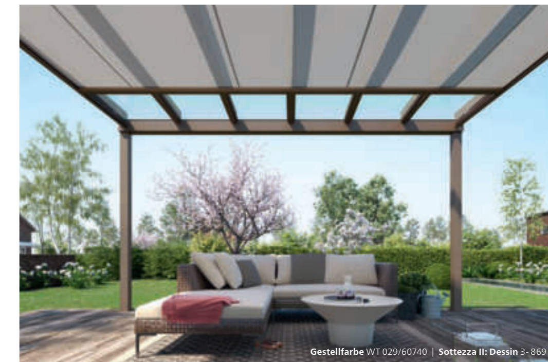
Gestellfarbe WT 029/60740 | Sottezza II: Dessin 3- 869

Ein angenehmes Klima auf Ihrer Terrasse verspricht die Wintergarten-Markise Sottezza II . Der dekorative Sonnenschutz ist formschön, schlank, zurückhaltend – und pflegeleicht. Denn Sottezza II ist unter dem Terrassendach angebracht. Das schützt sie vor Feuchtigkeit und Schmutz, das Tuch bleibt attraktiv und sauber.